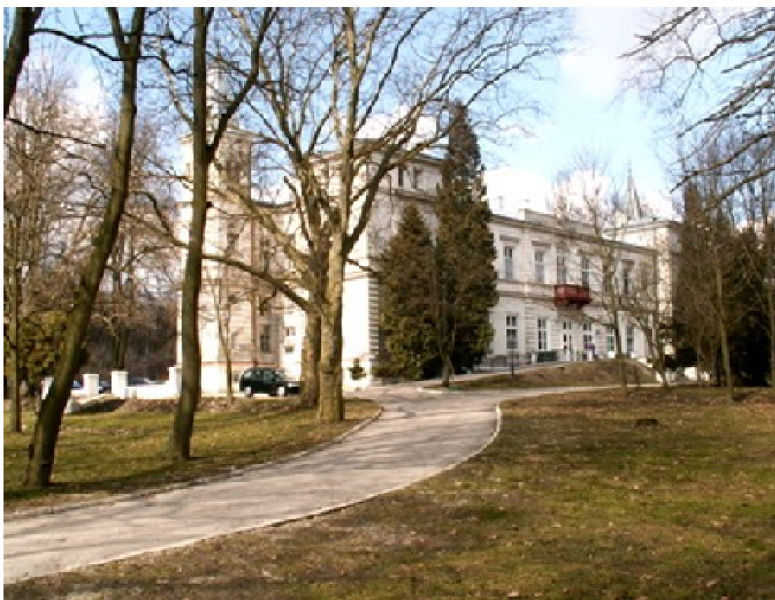
Zespół Pałacowo-Parkowy w Wiercicach

Na terenie gminy znajduje się 14 założeń dworsko - parkowych. Poszczególne założenia zachowane są w bardzo różnym stanie, często w dużej części zniszczone, zachowane fragmentarycznie, zniekształcone współczesnymi formami zagospodarowania.