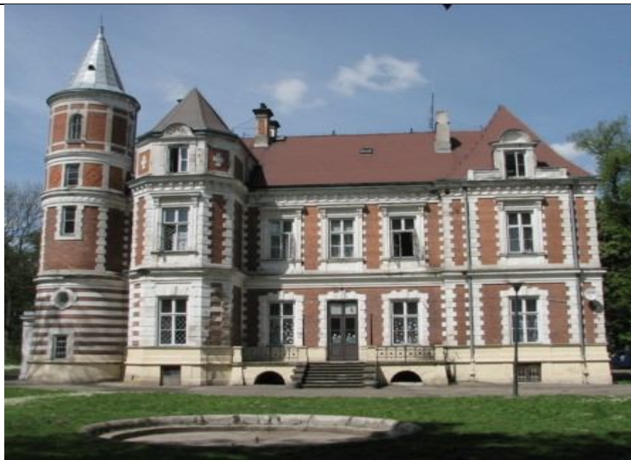
Zespół Pałacowo-Parkowy w Brześciu.