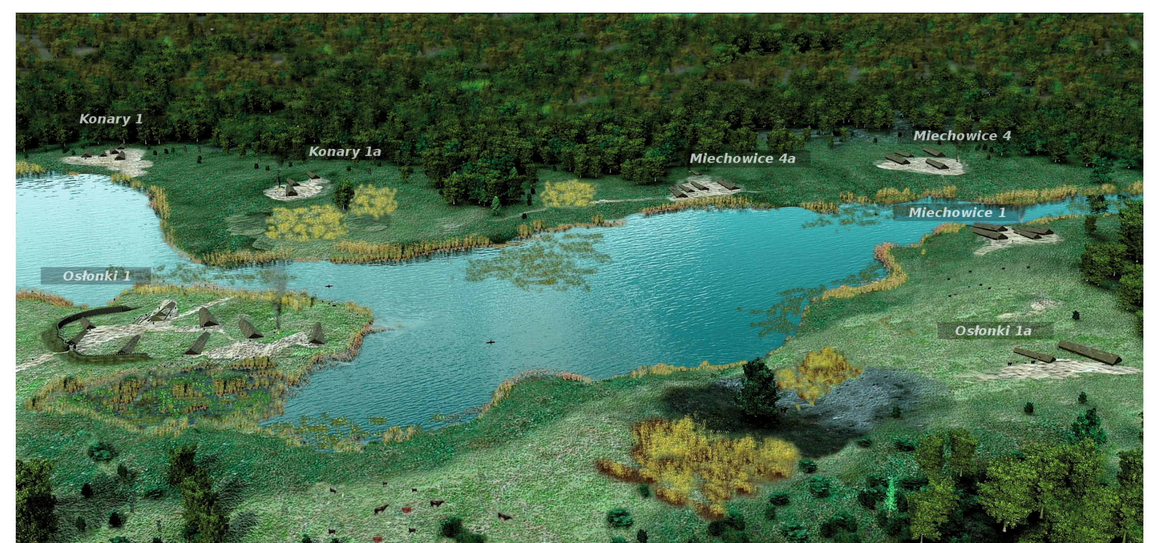
Rekonstrukcja osadnictwa grupy brzesko-kujawskiej kultury lendzielskiej w rejonie Osłonek i Miechowic

(od którego powstała nazwa całej grupy). Osadzie tej towarzyszyły mniejsze osiedla odkryte w Pikutkowie, Guźlinie, Gustorzynie oraz w Smółsku. Drugą osadę centralną odkryto w Osłonkach z mniejszymi osiedlami w Miechowicach, Konarach i Zagajewicach. Na podstawie badań można przypuszczać, że jednocześnie w jednym zgrupowaniu mogło zamieszkiwać do 20 rodzin.