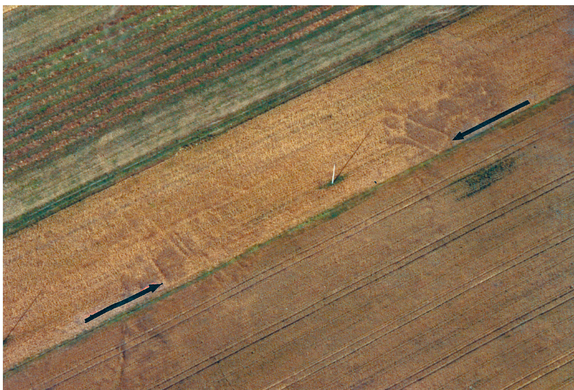
Pikutkowo, st. 6A, zdjęcie lotnicze. Zarzys domów trapezowatych ujawniają istnienie osady grupy brzesko-kujawskiej kultury lendzielskiej

W ewnętrzna organizację osad najlepiej rozpoznano w Brześciu Kujawskim (st. 4), gdzie odkryto m. in. unikatowy zespół obiektów związanych z domem nr 56. Na podstawie tych badań należy sądzić, że osiedla grupy brzesko-kujawskiej zamieszkiwane były przez samodzielne rodziny. Użytkowały one przez kilka pokoleń jeden, wydzielony obszar osady, gdzie budowano domy o charakterystycznym trapezowatym kształcie. Domy te były zbudowane z drewna i przykryte słomą bądź trzcina. Ściany budynków składały się z wbitych w podłoże bali drewnianych, które ciasno przylegając do siebie tworzyły konstrukcję nośną. Ściany posiadały solidne fundamenty i dla zwiększenia odporności były wylepiane gliną. Wielkość domów jest zróżnicowana i waha się od kilkunastu metrów – w przypadku budynków najstarszych, do 40 metrów – w przypadku budynków z czasów świetności grupy brzesko-kujawskiej. Budynki podzielone były z reguły na trzy części, z których najszerza była mieszkalna, a dwie pozostałe służyły celom gospodarczym, np. jako schronienie dla zwierząt i do gromadzenia zapasów.