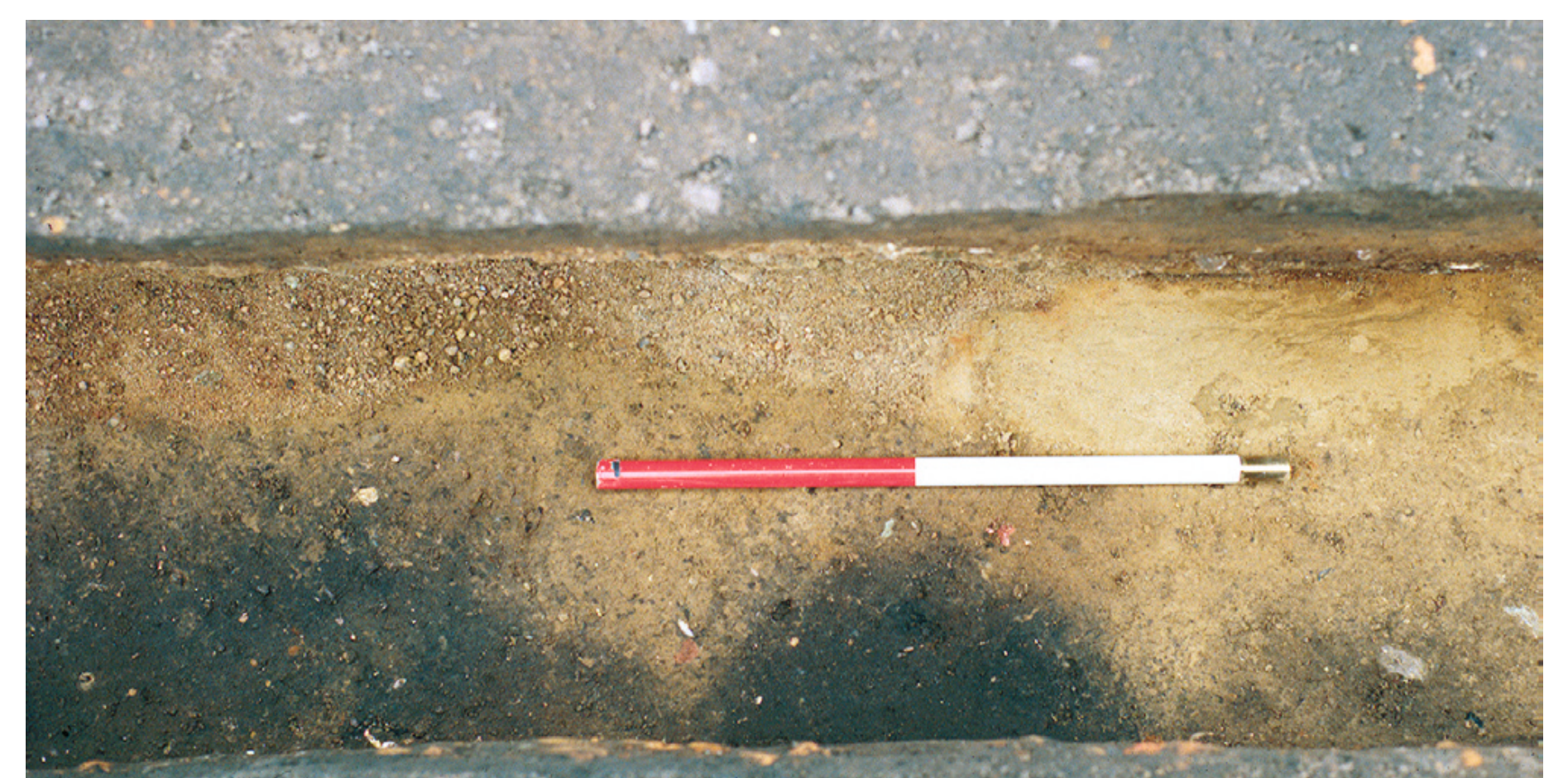
Brześć Kujawski, st. 4. Dom nr 56, zarzys spalonych bali drewnianych na dnie fundamentów