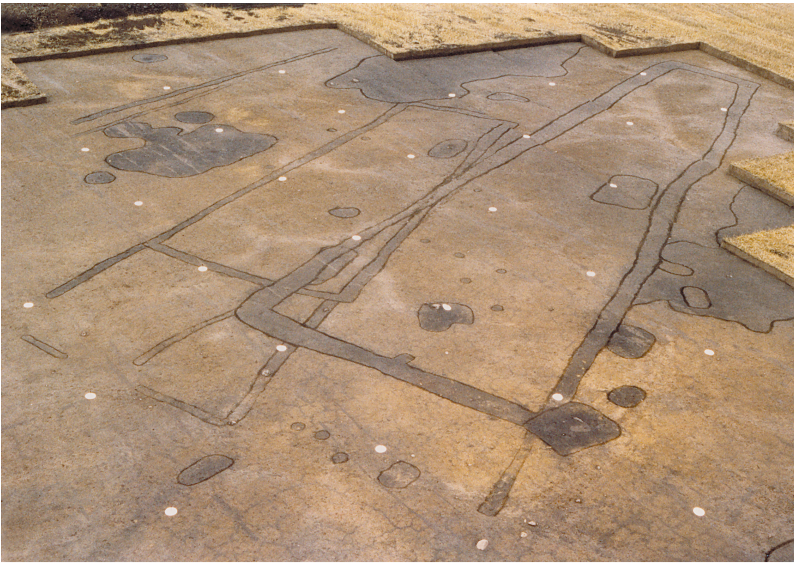
Miechowice, st. 4. Zgrupowanie domów trapezowatych grupy brzesko-kujawskiej kultury lendzielskiej

W ewnętrzna organizację osad najlepiej rozpoznano w Brześciu Kujawskim (st. 4), gdzie odkryto m. in. unikatowy zespół obiektów związanych z domem nr 56. Na podstawie tych badań należy sądzić, że osiedla grupy brzesko-kujawskiej zamieszkiwane były przez samodzielne rodziny. Użytkowały one przez kilka pokoleń jeden, wydzielony obszar osady, gdzie budowano domy o charakterystycznym trapezowatym kształcie. Domy te były zbudowane z drewna i przykryte słomą bądź trzcina. Ściany budynków składały się z wbitych w podłoże bali drewnianych, które ciasno przylegając do siebie tworzyły konstrukcję nośną. Ściany posiadały solidne fundamenty i dla zwiększenia odporności były wylepiane gliną. Wielkość domów jest zróżnicowana i waha się od kilkunastu metrów – w przypadku budynków najstarszych, do 40 metrów – w przypadku budynków z czasów świetności grupy brzesko-kujawskiej. Budynki podzielone były z reguły na trzy części, z których najszerza była mieszkalna, a dwie pozostałe służyły celom gospodarczym, np. jako schronienie dla zwierząt i do gromadzenia zapasów.