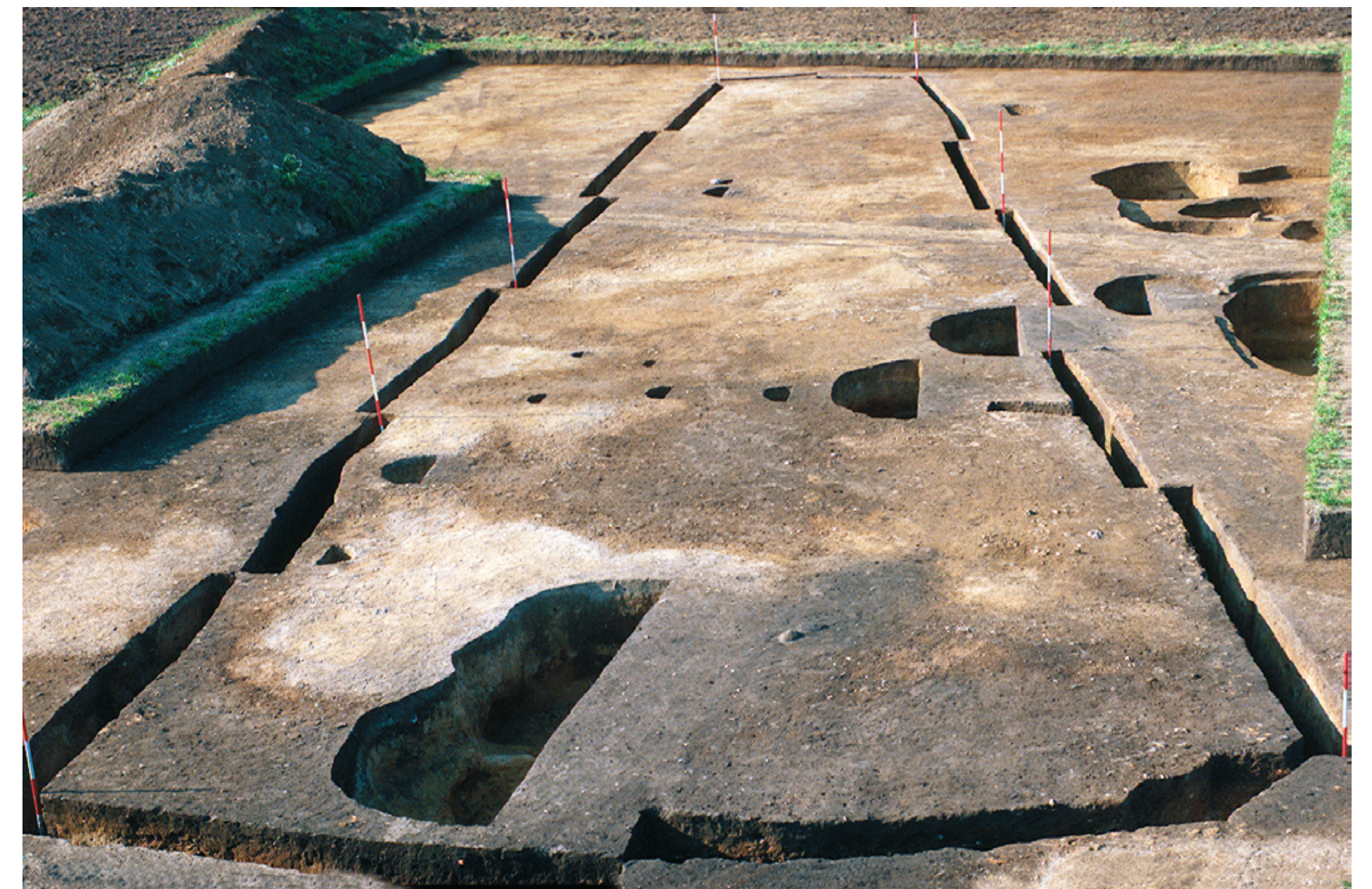
Brześć Kujawski, st. 4. Dom nr 56, w czasie eksploracji fundamentów