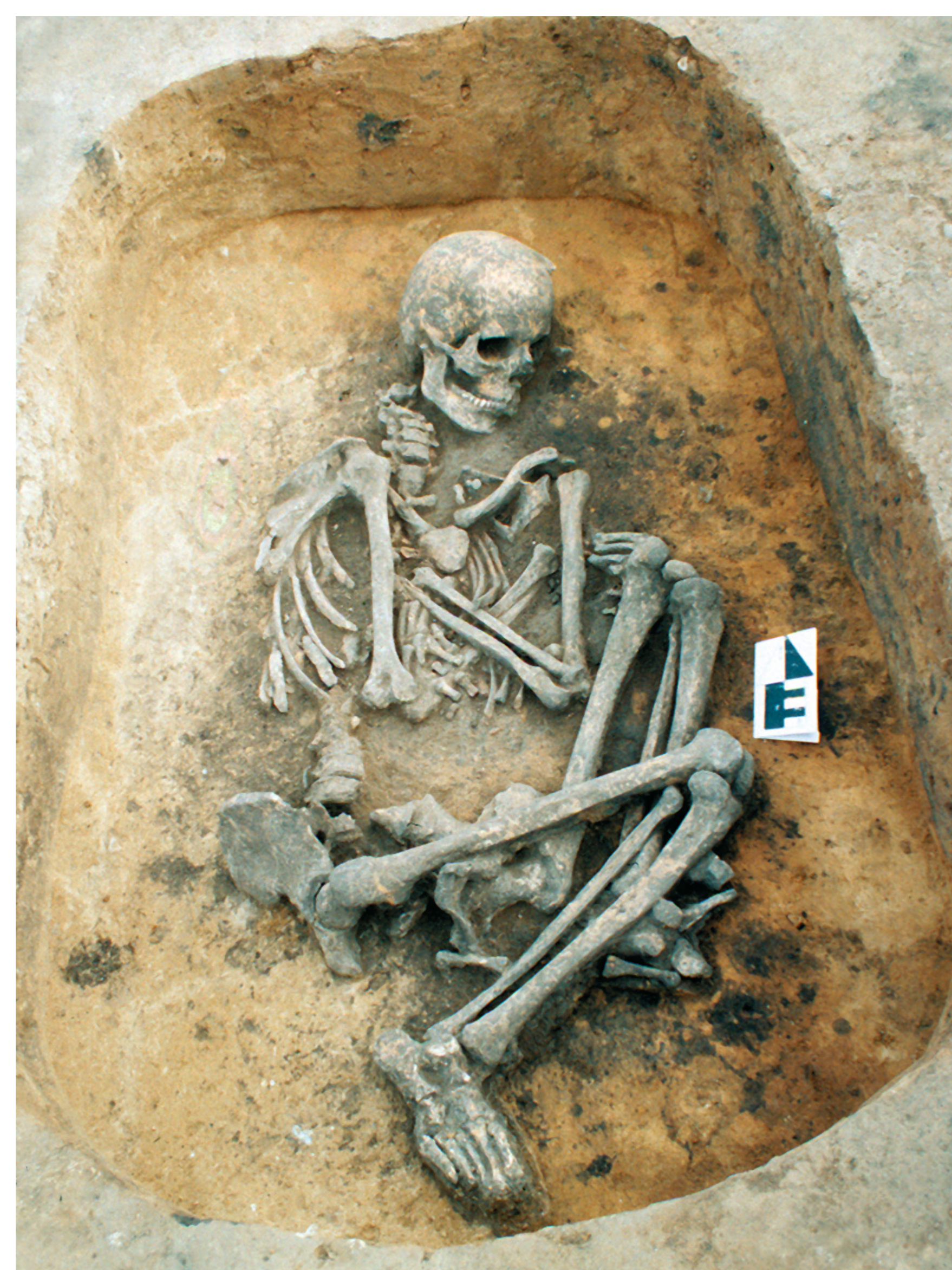
Miechowice, st. 4. Grób żeński grupy brzesko-kujawskiej