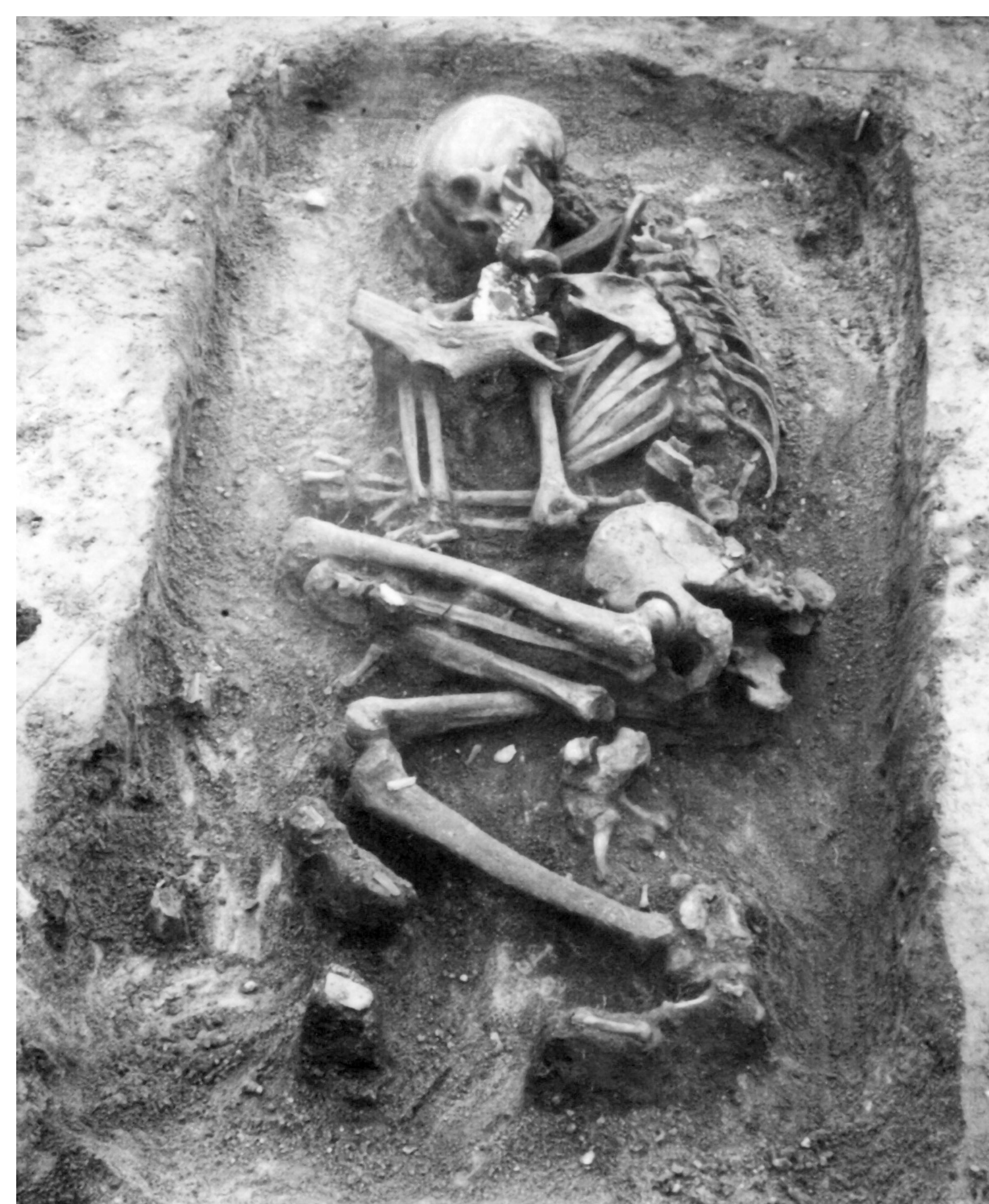
Brześć Kujawski, st. 4. Grób męski grupy brzesko-kujawskiej