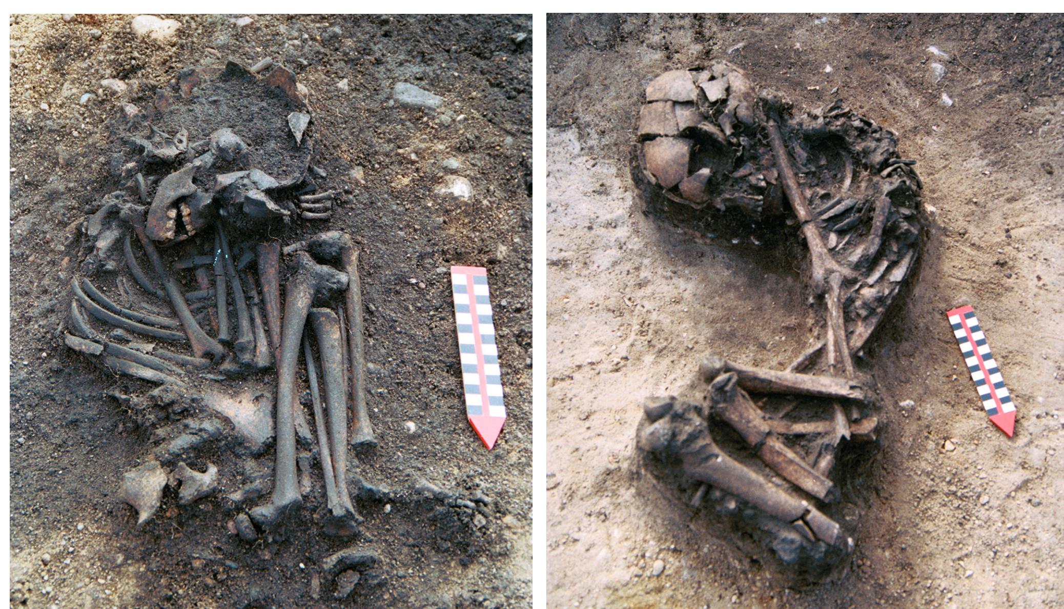
Pikutkowo, st. 6A. Groby dzieci grupy brzesko-kujawskiej