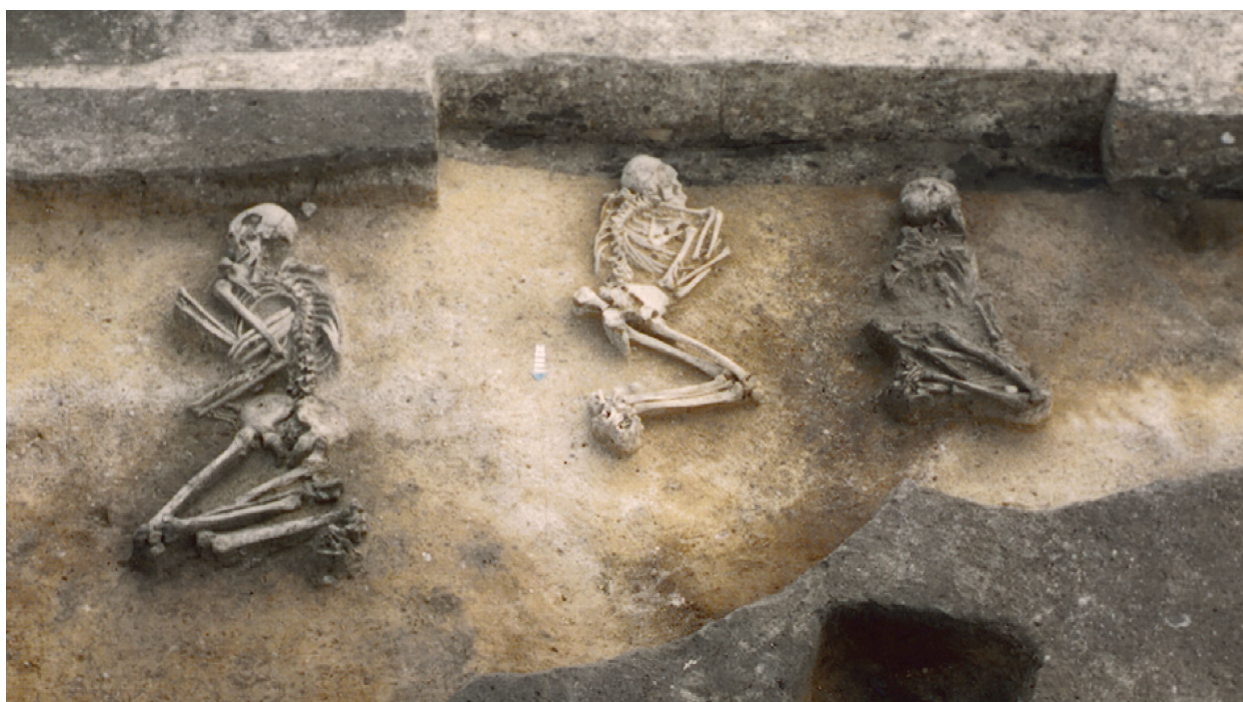
Brześć Kujawski, st. 4. Rodzinny cmentarzyk związany z domem nr 56

T eren podwórza w grupie brzesko-kujawskiej kultury lendzielskiej służył nie tylko działalności gospodarczej. W jego obrębie chowano również zmarłych. Odbywało się to na wydzielonych niewielkich cmentarzyskach lub wzdłuż domu, a nawet we wcześniej wykorzystywanych obiektach gospodarczych. W grobie osobę zmarłą układano w pozycji skurczonej, na boku, z głową skierowaną na południe. Mężczyzn chowano na prawym, a kobiety na lewym boku. Dzięki drobiazgowym analizom specjalistycznym (antropologicznym) odkrytych szkieletów uzyskano wiele cennych informacji opisujących wygląd i zwyczaje społeczności zamieszkującej rejon Brześcia Kujawskiego. Ówczesnych ludzi należy charakteryzować jako niskich (średnio dla mężczyzn 163 cm, a dla kobiet 150 cm) o krępej budowie ciała. Z powodu wykonywania ciężkiej pracy ludzie ci często cierpieli na różnego rodzaju schorzenia. Powszechne były zwyrodnienia stawów i zmiany w kręgosłupie. Dokuczały im również choroby zębów. Wielokrotnie, szczególnie u dzieci, stwierdzono przejawy niedożywienia i braku niektórych mikroelementów, np. żelaza. W kilku przypadkach zaobserwowano urazy, które prawdopodobnie powstały w wyniku prowadzenia walk międzyplemiennych. Ciężka praca oraz choroby powodowały, że ludzie z Brześcia Kujawskiego i Osłonek nie żyli długo. Średnia wieku tylko nieznacznie przekraczała 35 lat.