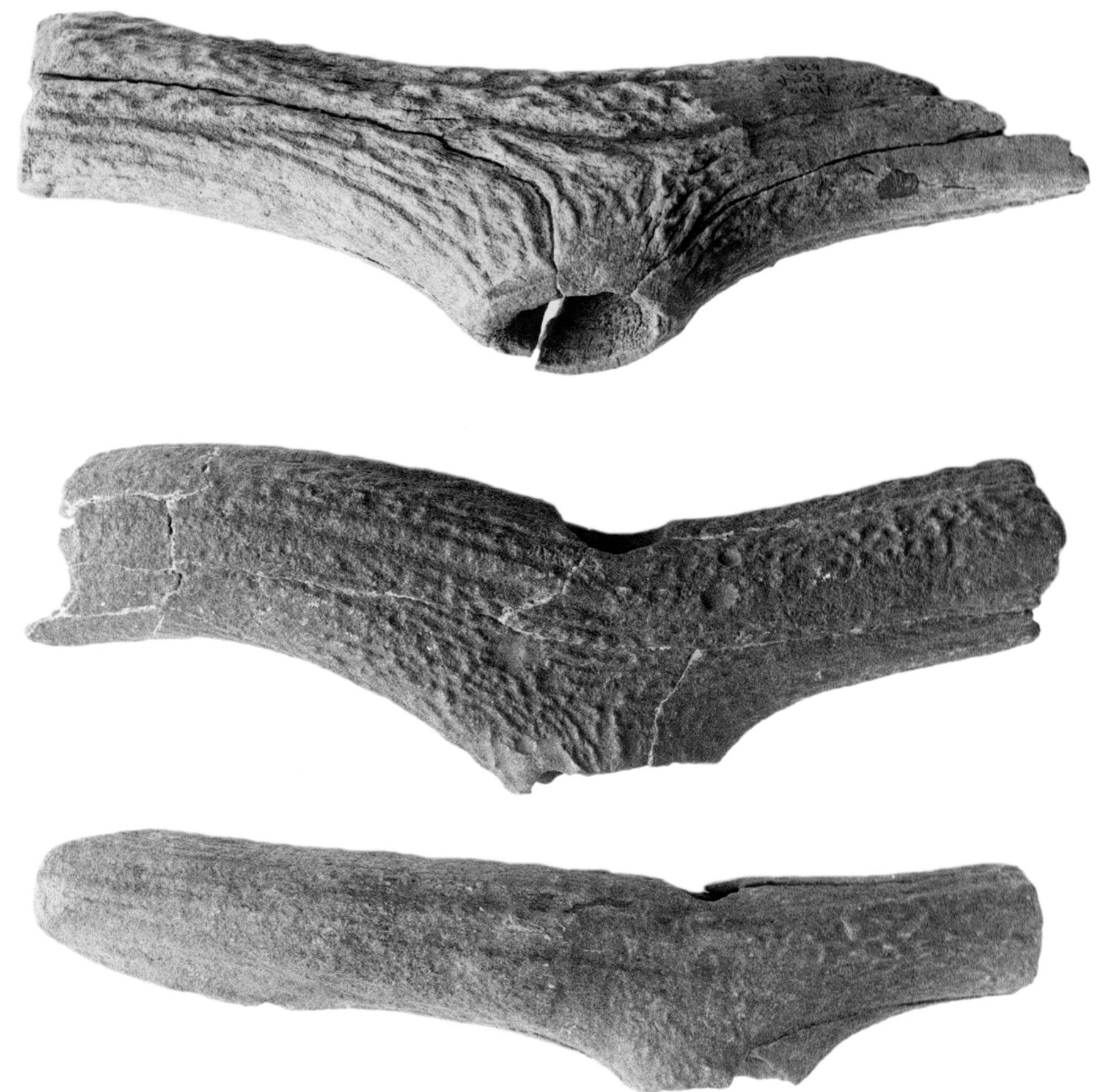
Brześć Kujawski, st. 4. Topory rógowe odkryte w grobach