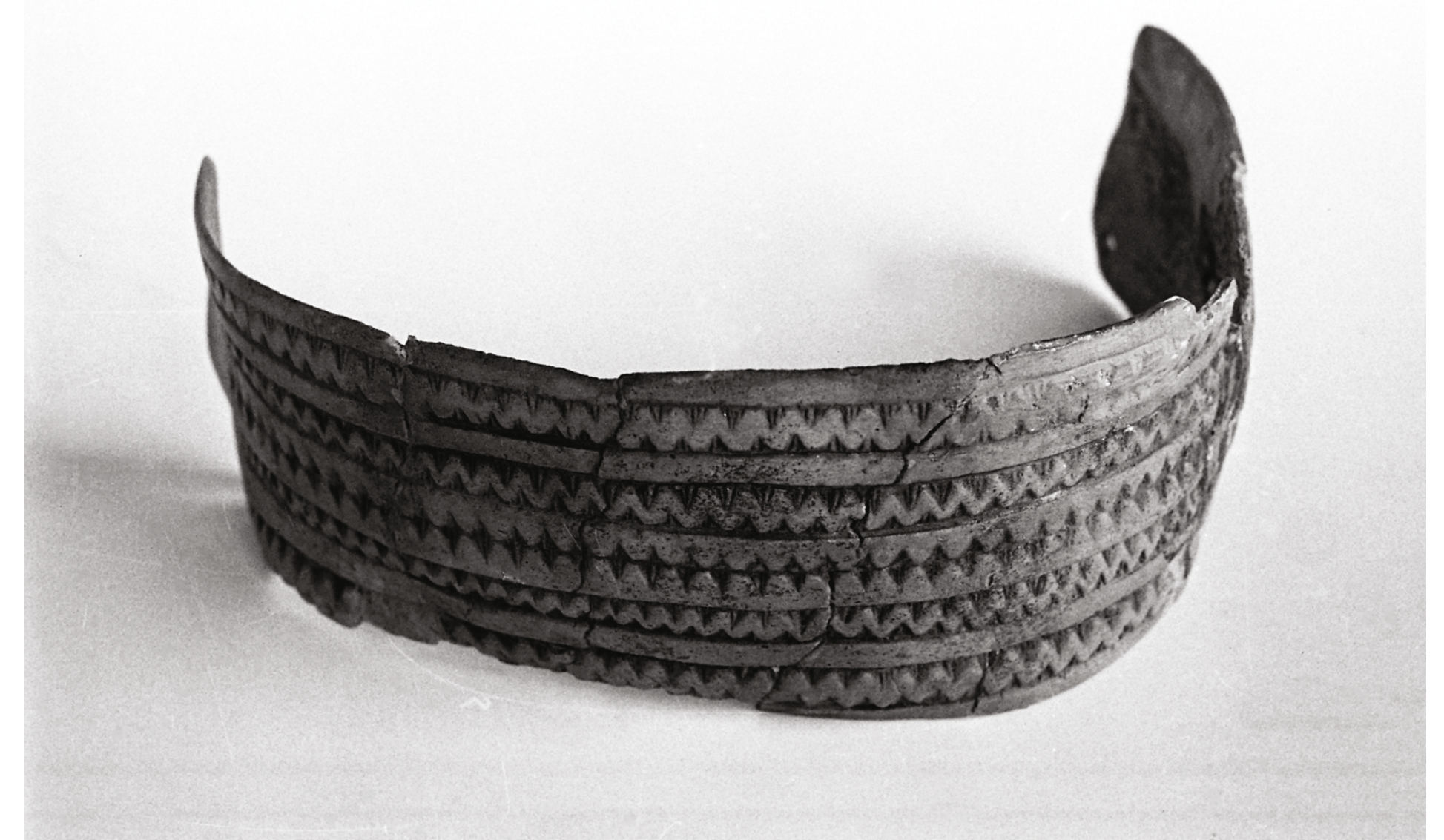
Brześć Kujawski, st. 4. Naramiennik wykonany z żebra krowy