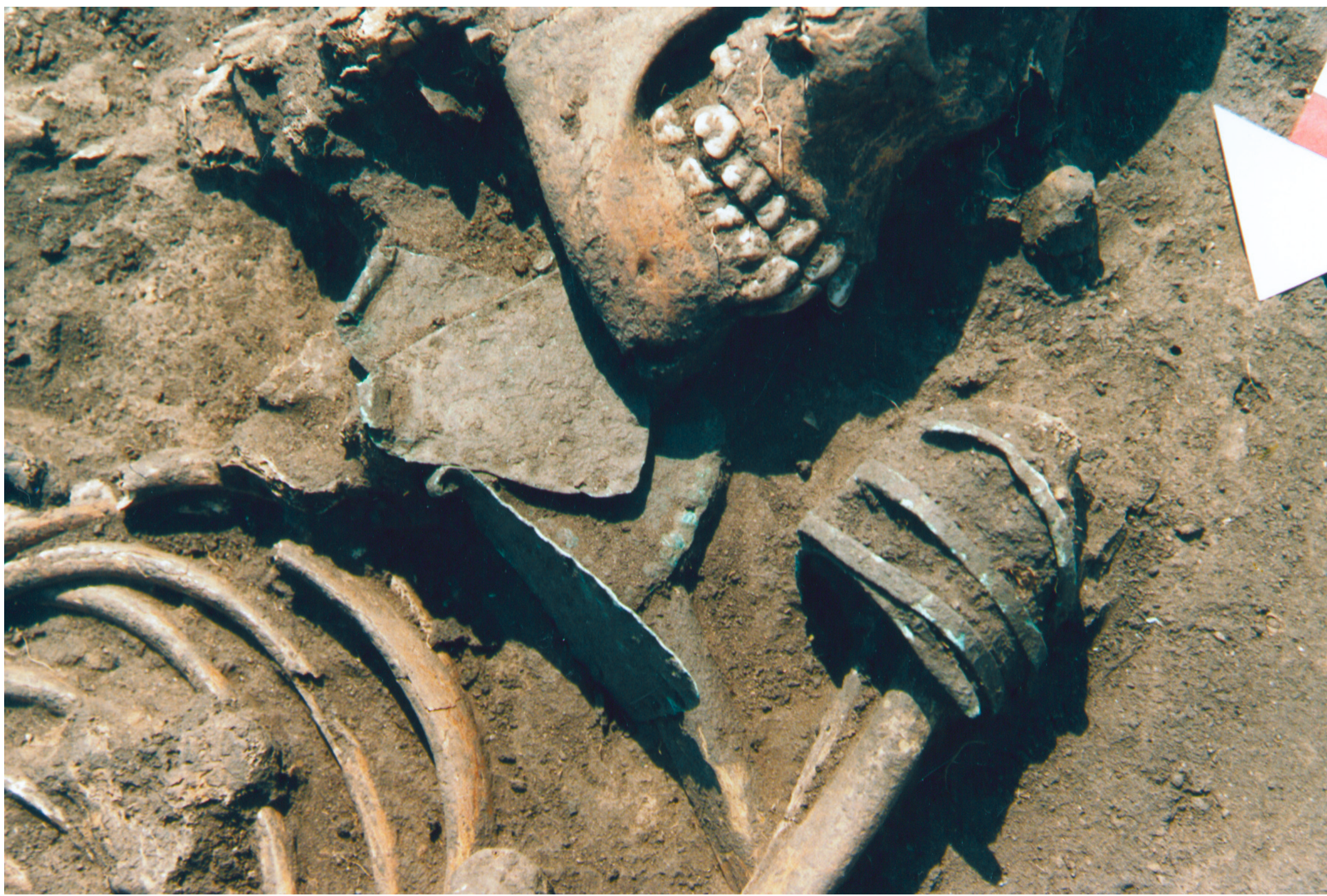
Położenie miedzianej bransolety i naszyjnika w grobie grupy brzesko-kujawskiej kultury lendzielskiej

Wybitnym jednostkom do grobu wkładano bogate dary. W przypadku mężczyzn były to przedmioty świadczące o ich społecznym prestiżu. Można tu wymienić elementy uzbrojenia, w postaci toporów rógowych i sztyletów kościanych, specjalistyczne narzędzia czy też ozdoby, np. koliste medaliony i bogato zdobione naramienniki kościane. Szczególnie cenne były przedmioty wykonane z wciąż bardzo rzadkiego metalu - miedzi. Do grobów kobiet wkładano głównie ozdoby i biżuterię, a rzadziej naczynia lub narzędzia świadczące o ich wyjątkowych umiejętnościach (np. igłę, szydło, ciężarek tkacki itp.). Broń oraz większość ozdób i biżuterii wykonywano na miejscu. Do ich produkcji używano ogólnie dostępnych surowców w postaci: rogu, kości, muszli i zębów zwierzęcych, a nawet kręgów ryb. Tylko wyjątkowo wartościowe przedmioty, np. wykonane z bursztynu i miedzi były sprowadzane z zewnątrz, czasem nawet z bardzo daleka, np. dzisiejszej Słowacji i Austrii.