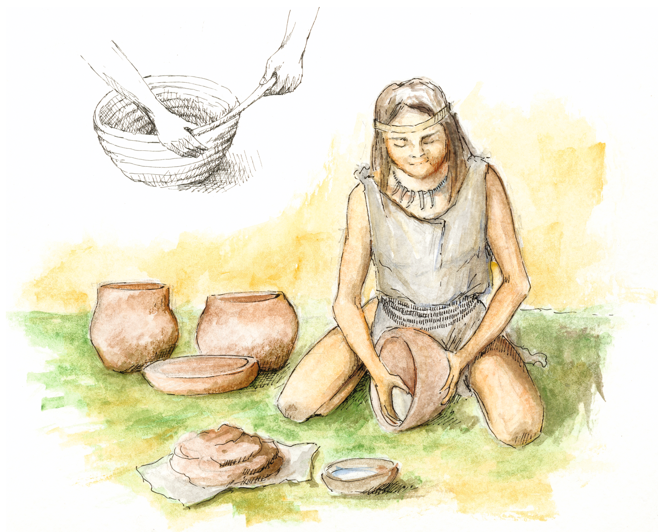
Ręczne wytwarzane naczyn

Naczynia i ich fragmenty są najliczniejszą grupą zabytków pochodzących z badań wykopaliskowych w rejonie Brześcia Kujawskiego. Szczegółowa analiza w zakresie zmienności form i ornamentyki pozwala na określenie chronologii poszczególnych odkryć oraz na śledzenie kontaktów regionalnych i dalekosiężnych. W grupie brzesko-kujawskiej kultury lendzielskiej naczynia wytwarzano wyłącznie ręcznie. Do ich produkcji służyła miejscowa glina wydobywana z tzw. glinianek. Przed użyciem surowiec był poddawany różnego rodzaju zabiegom. Najpierw przemywano go wodą, potem leżakował w ziemi, a następnie dodawano do niego ściśle określoną domieszkę schudzającą glinę, wytwarzaną przede wszystkim z rozkruszonych kamieni. Po tych zabiegach przystępowano do wyrobu naczyń zaczynając od dna, do którego doklejało wałki formujące ścianki naczynia. Na koniec ceramikę wygładzano i ornamentowano. Po wstępnym wysuszeniu na słońcu naczynia wypalano w ogniskach. Gotowe wyroby służyły do gotowania oraz jako pojemniki do przechowywania żywności i napojów. Formami szczególnymi są lampki ceramiczne, które po wypełnieniu tłuszczem używano do oświetlania domów i specjalistycznych warsztatów. Z gliny wyrabiano również łyżki, a ze zniszczonych naczyń ciężarki tkackie.