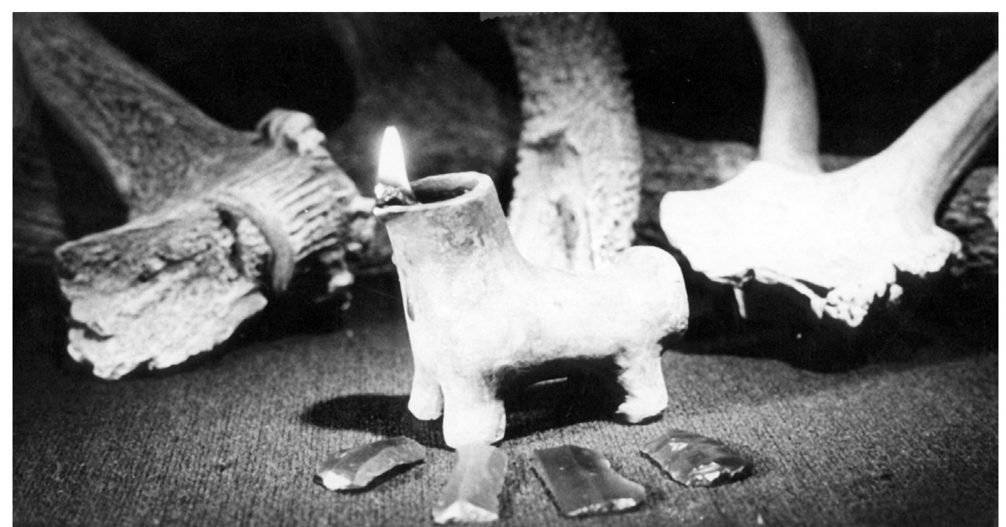
Rekonstrukcja używania lampek ceramicznych odkrytych na st. 4 w Brześciu Kujawskim