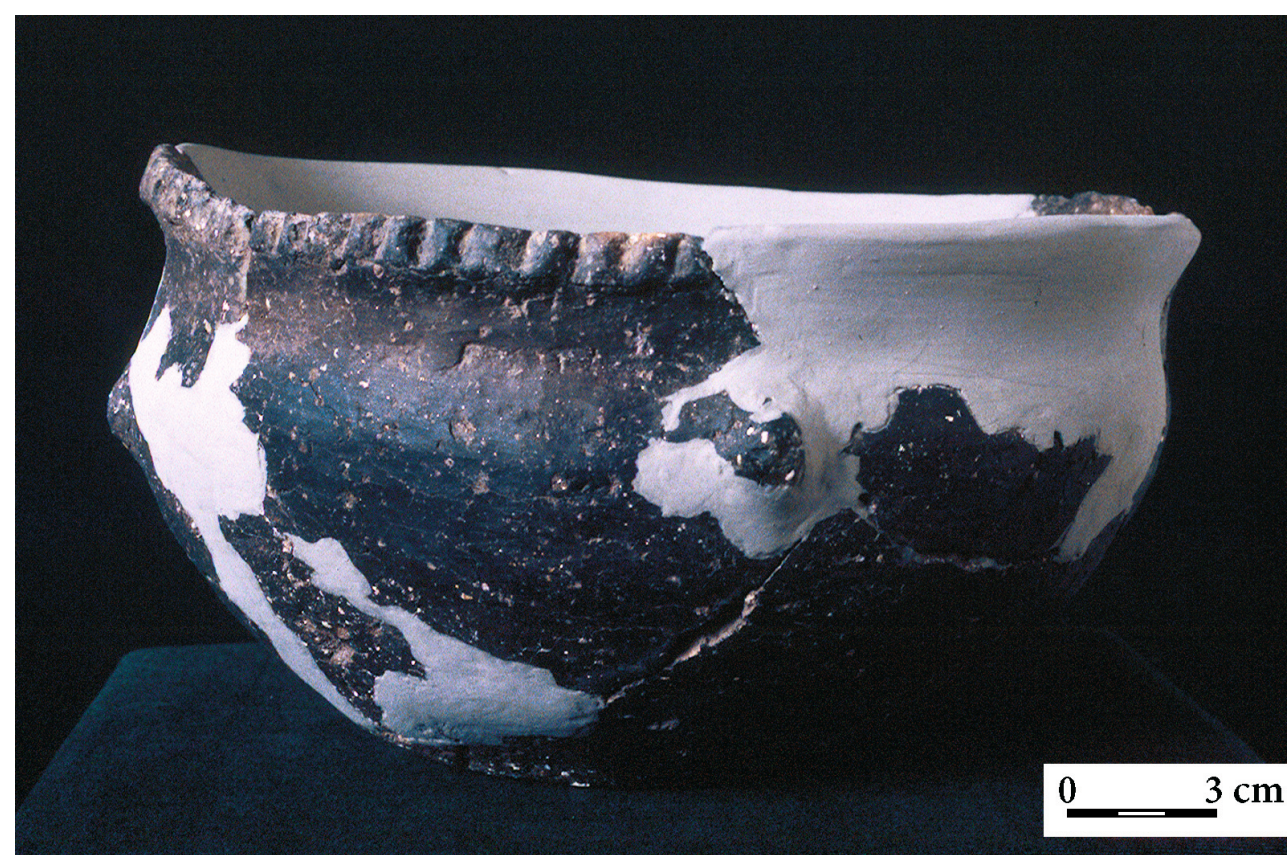
Brześć Kujawski, st. 3. Widok naczynia odkrytego w czasie badań wykopaliskowych i jego rekonstrukcja