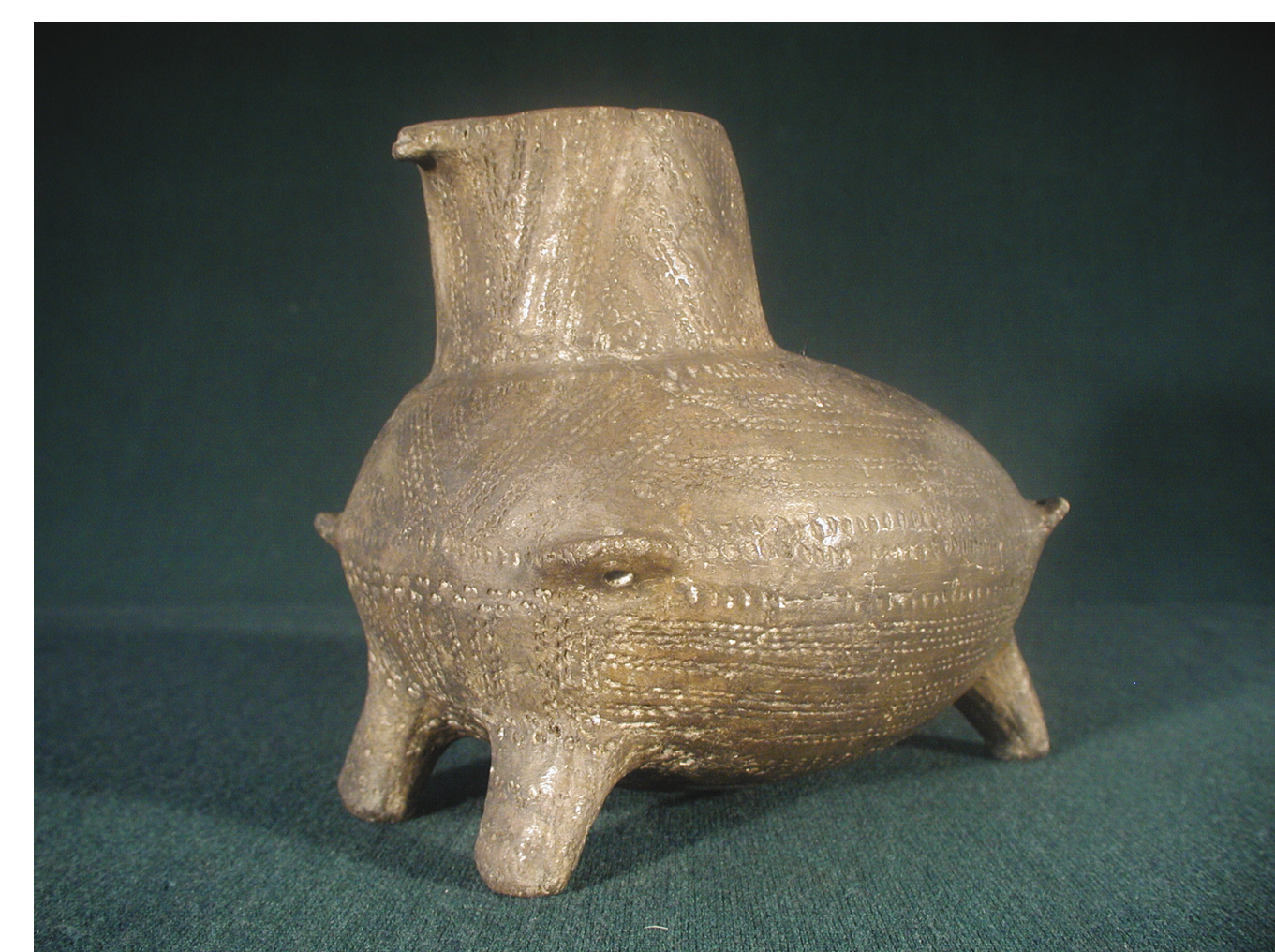
Naczynie zoomorficzne w kształcie kaczki