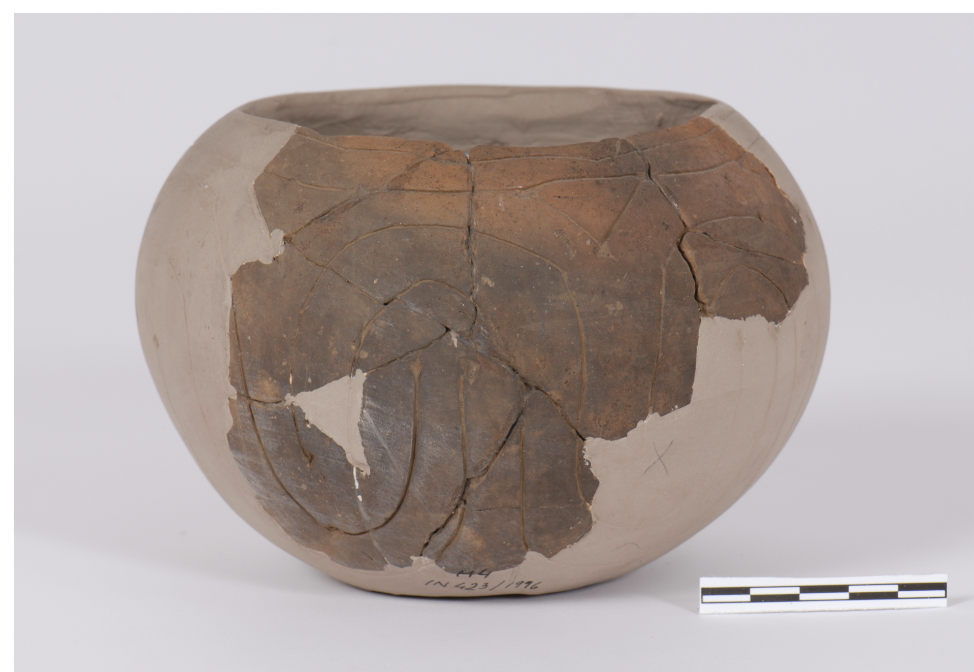
Miechowice, st. 4. Naczynie kultury ceramiki wstęgowej rytej