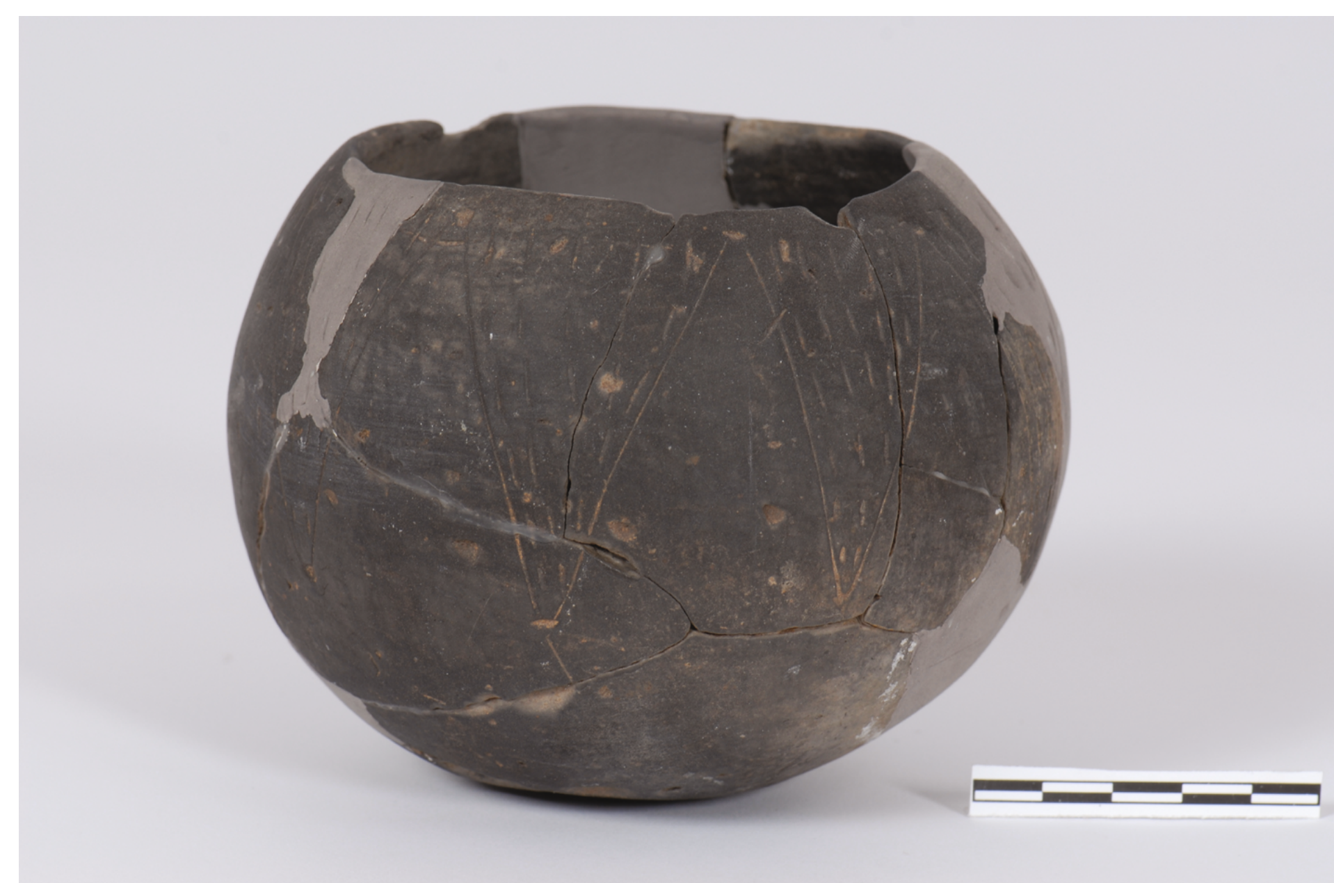
Miechowice, st. 4. Naczynie kultury ceramiki wstęgowej rytej