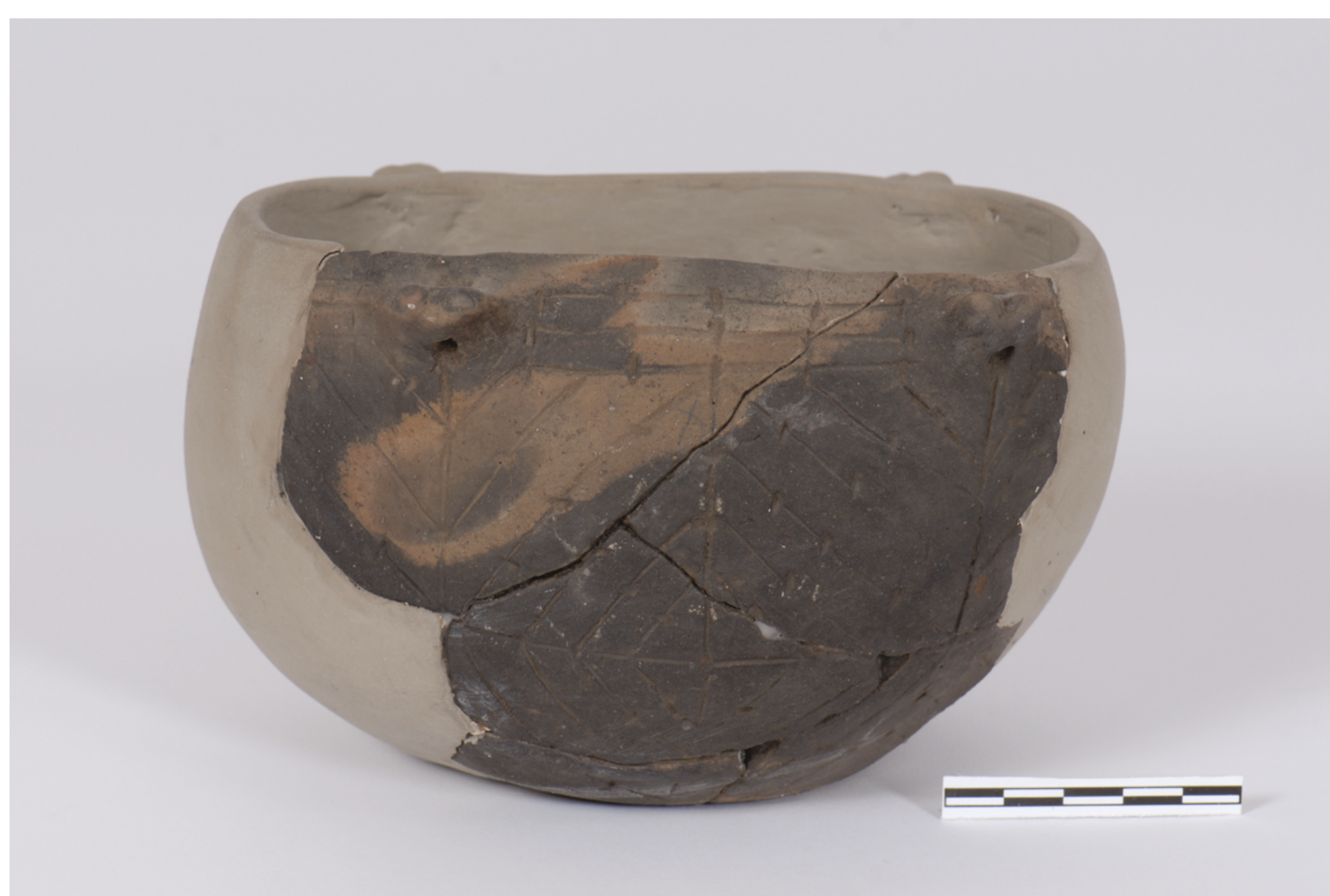
Miechowice, st. 4. Naczynie kultury ceramiki wstęgowej rytej