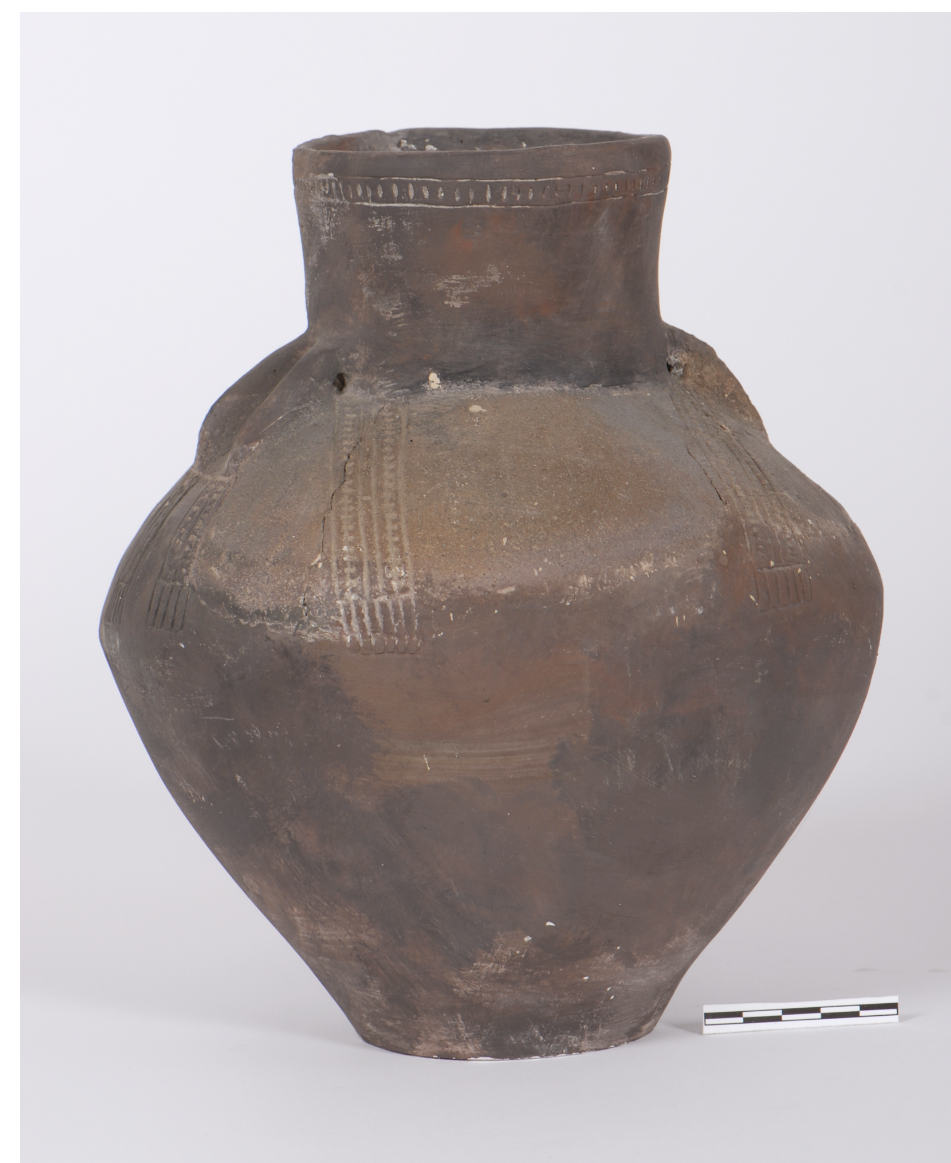
Wolica Nowa, st. 1. Amfora kultury pucharów lejkowatych