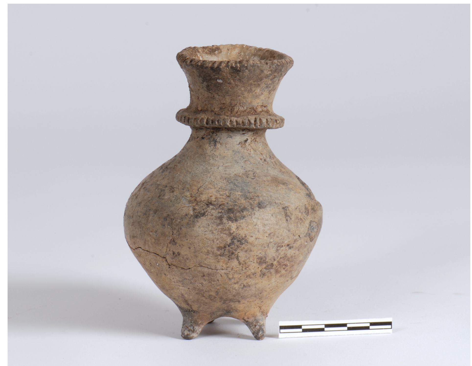
Wolica Nowa, st. 1. Flaszka z kryzą kultury pucharów lejkowatych