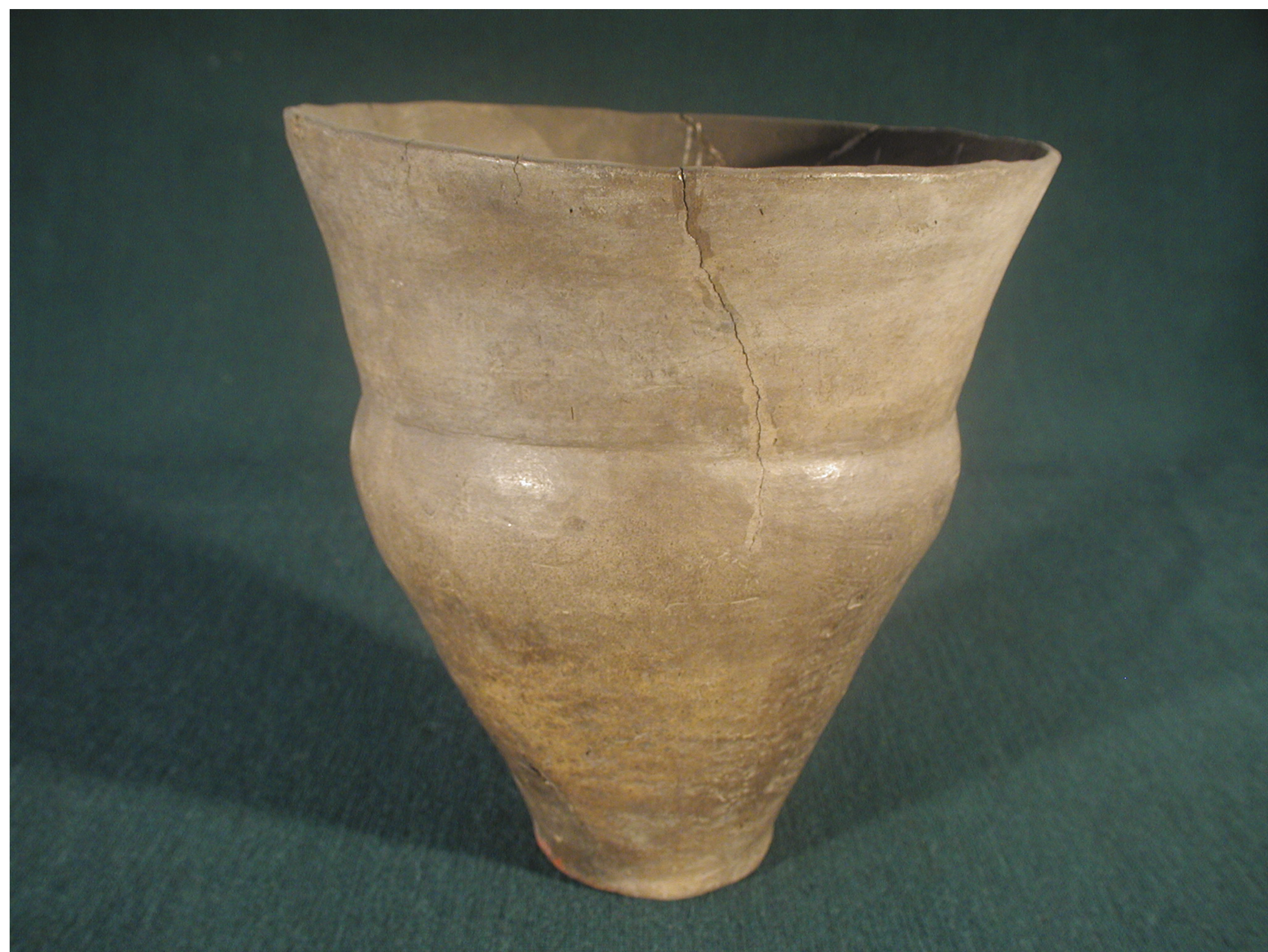
Pikutkowo, st. 6. Puchar kultury pucharów lejkowatych

W końcu V tys. p.n.e. na terenach niżu europejskiego, od dzisiejszej Holandii po Kujawy, doszło do powstania nowej cywilizacji neolitycznej - nazwanej od charakterystycznego kształtu naczynia - kulturą pucharów lejkowatych. W archeologii najczęściej przyjmuje się, że twórcami nowej kultury byli dawni myśliwi, którzy pod wpływem kultur południowych stopniowo nauczyli się rolnictwa i hodowli. W wyjaśnieniu początków tworzenia się nowej społeczności bardzo ważne mogą okazać się odkrycia dokonane ostatnio w Redczu Krukowym. Na stanowisku tym rozpoznano wielodomową osadę z najstarszego horyzontu kultury pucharów lejkowatych, pozyskując ponad 100 tys. zabytków, głównie fragmentów naczyń i wyrobów krzemiennych. Tak bogate odkrycia są dużym zaskoczeniem, bowiem ich liczba przekracza wszystkie dotychczas znane materiały z początków kultury pucharów lejkowatych z całej środkowej Europy.