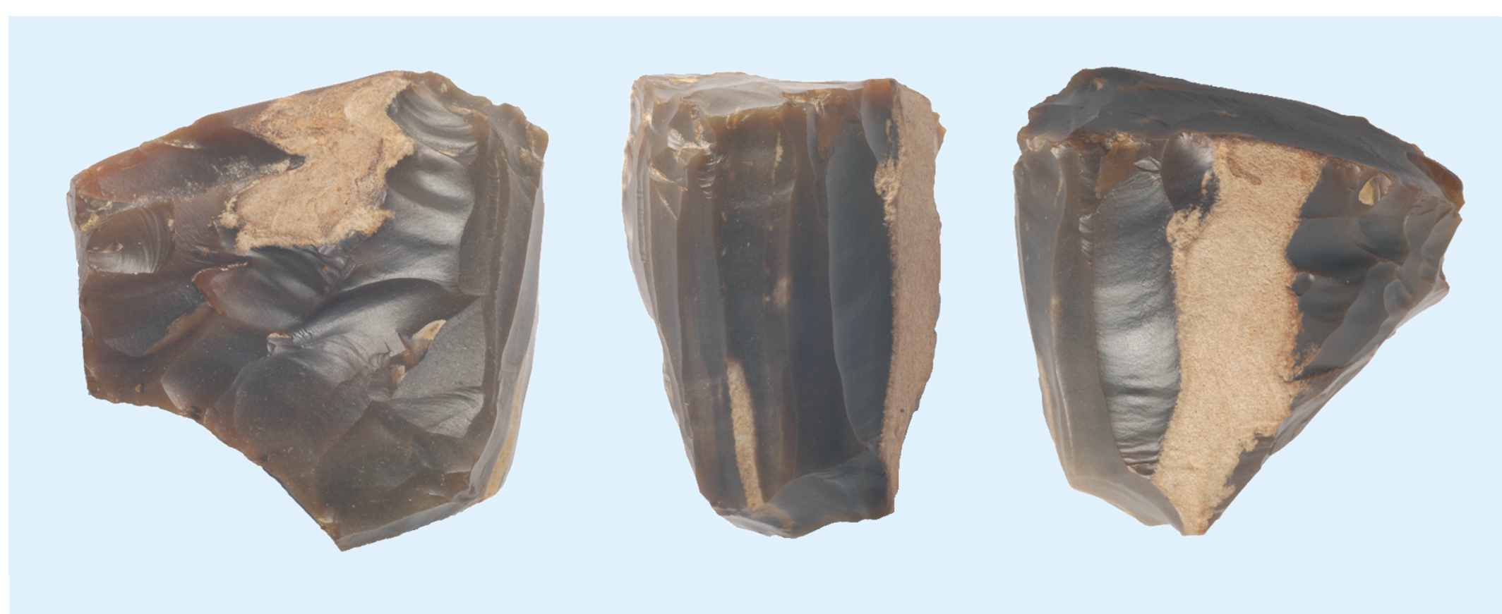
Redecz Krukowy, st. 20. Rdzeń krzemienny kultury pucharów lejkowatych

Omawiana kultura po zaniku grupy brzesko-kujawskiej kultury lendzielskiej szybko opanowała Kujawy, a później obszar całej Polski. W rejonie Brześcia Kujawskiego z młodszych faz rozwoju kultury pucharów lejkowatych rozpoznano szereg osad i cmentarzysk. Do najważniejszych należą stanowiska położone w Pikutkowie, Nowym Młynie, Wolicy Nowej (Polówce), Starym Brześciu i Brześciu Kujawskim.